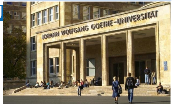
Unten: Raum für Gedanken: "Deutschlands schönster Campus" bietet traumhafte und zugleich modernste Studienbedinaunaen. Das Casino-Gebäude