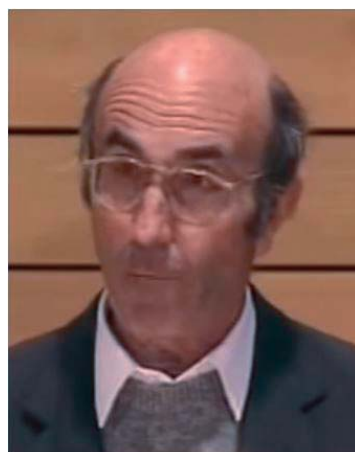
Niklas Luhmann

Gegenstandes, die empirischen und theoretischen Untersuchungen sowie letztlich die Formulierung eines wissenschaftlich wahren Erkenntnisgewinns. Es muss Sprache verwendet werden, ganz gleich in welcher Codierung, die potenziell präzisierten Sinn an andere vermitteln kann. Erst dann werden wissenschaftliche Diskurse konstruktiv, d. h. es können Überprüfungen, Verbesserungen, Differenzierungen und auch Bestätigungen oder Ablehnungen möglich werden. Theoretische Konzepte sollen jeweils helfen, relevante Untersuchungsobjekte zu benennen, die Herangehensweise an sie zu inspirieren sowie Zusammenhänge der Beobachtungen zu beschreiben und auch zu erklären. Wenn das aussichtsreich auf wissenschaftliche Weise geschehen soll, sind Abstraktionsgrade für die Begrifflichkeit notwendig, die in der Regel weit über die Abstraktionen hinaus gehen, die in der Umgangssprache bereits inkludiert und plausibel sind.